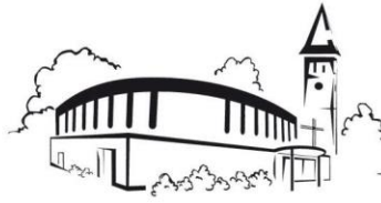
Werpeloh St. Franziskus